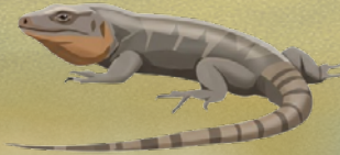
Lagarto de Gran Canaria