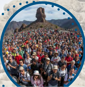
Turismo masivo e irresponsable