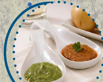
Pérdida de las tradiciones