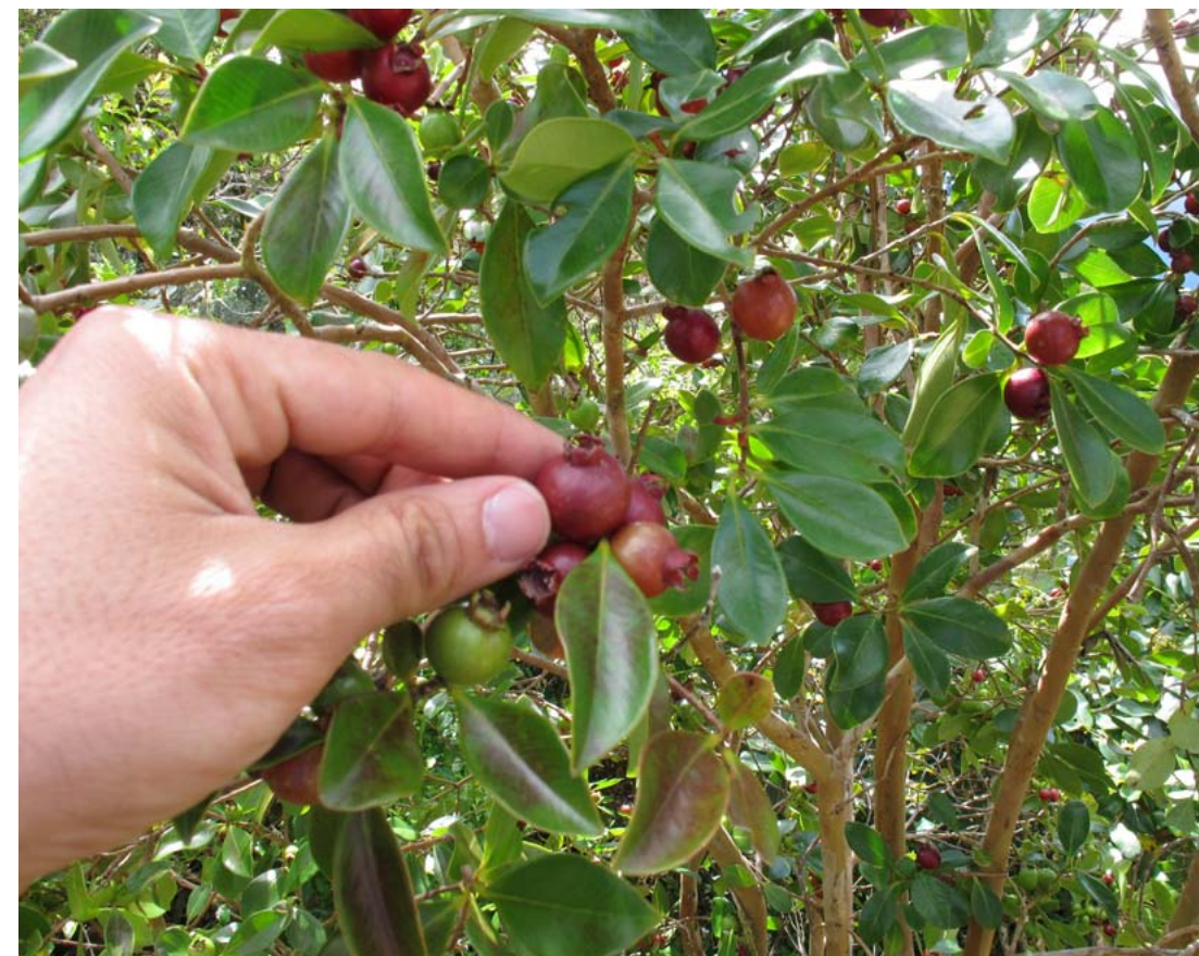
La guayaba fresa ( Psidium cattleianum ), arbolillo altamente invasor, al igual que ocurre en Hawái y Galápagos, que posee un fruto muy apreciado por los locales. (Foto: A. J. Pérez).

Se calcula que en La Reunión hay unas 500 especies de arañas, el 25% de ellas endémicas (Ledoux, 2004 y 2007), aunque en los estudios realizados en bosques húmedos para el proyecto ISLAND-BIO-