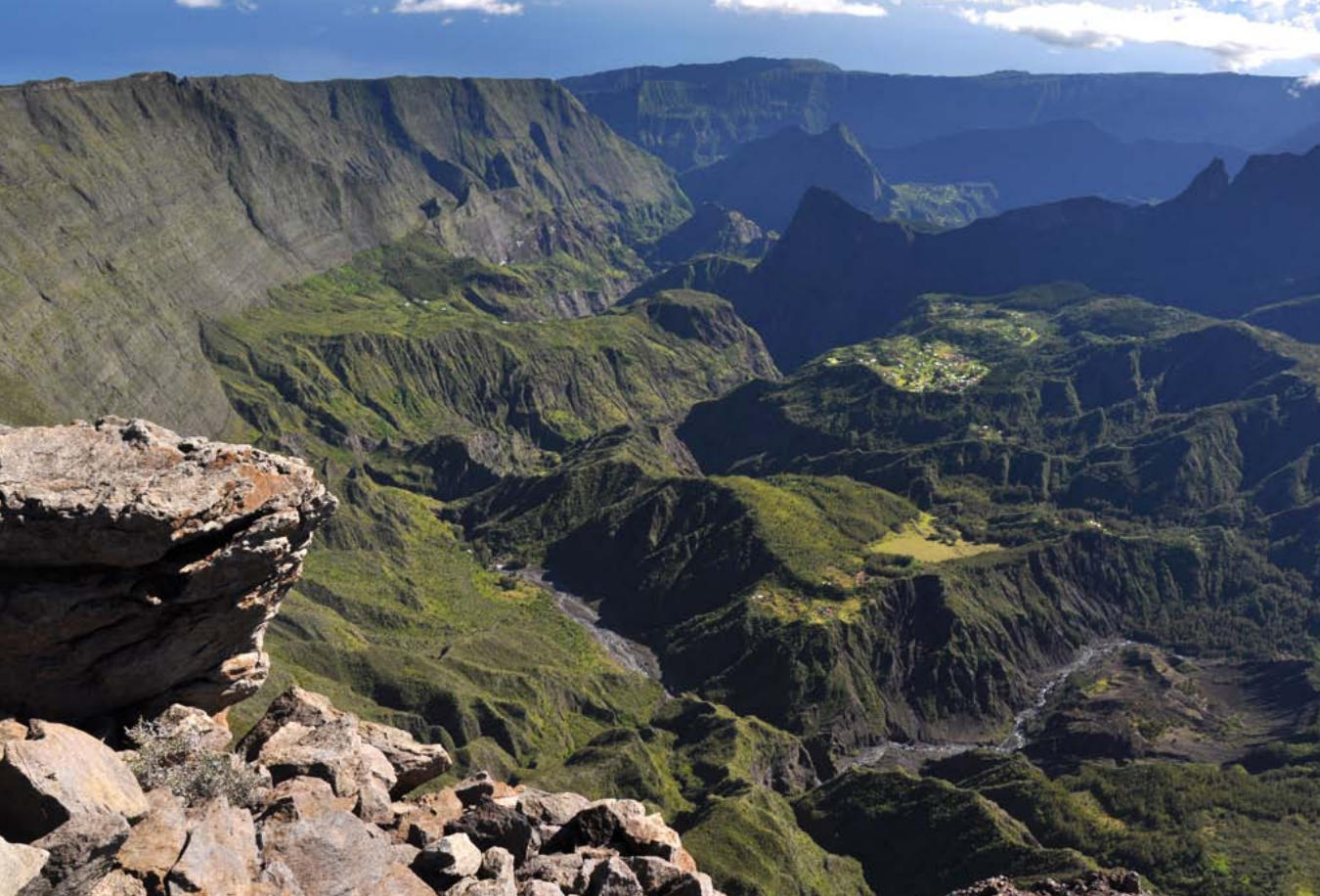
Mafate es el más abrupto de los tres grandes circos de la isla, y carece de acceso para vehículos.