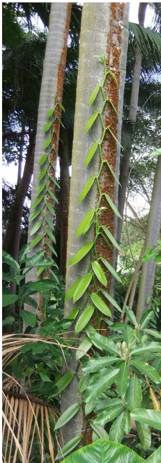
Planta de vainilla trepando por una palmera.

aparición a principios del siglo XVIII; era el llamado solitario de La Reunión, del cual se especuló largo tiempo sobre su parentesco con el dodó de Mauricio (Mourer-Chauviré et al. , 1995). Es particularmente alarmante la expansión del caracol gigante africano ( Achatina fulica ), un molusco invasor introducido en muchos lugares del mundo, que entre otras especies vegetales devora los brotes jóvenes de la ortiga Obetia ficifolia , planta huésped exclusiva de la mariposa en peligro Salamis agustina .