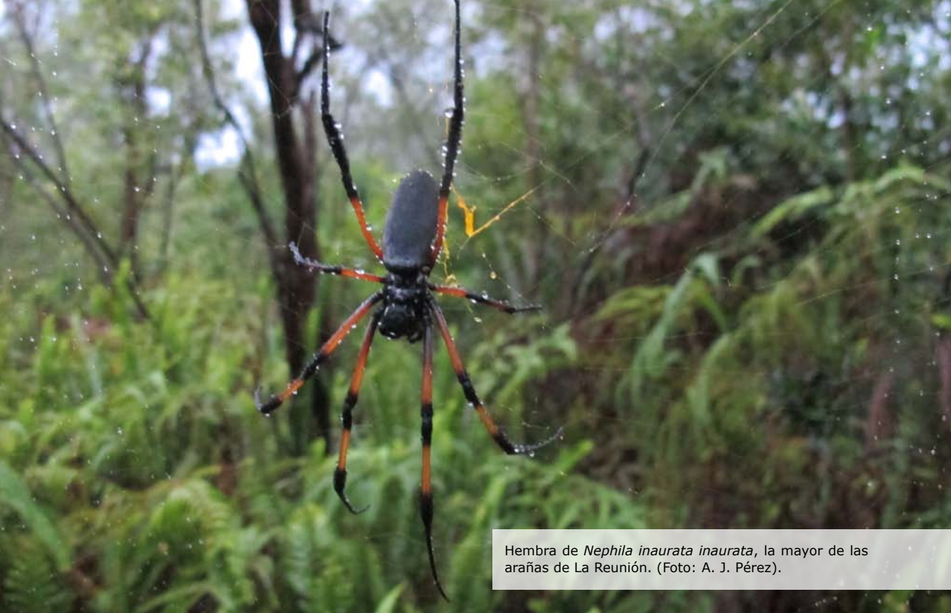
Hembra de Nephila inaurata inaurata , la mayor de las arañas de La Reunión. (Foto: A. J. Pérez).