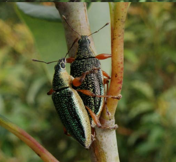
Cuatro de las 36 especies endémicas del género Cratopus (f. Curculionidae), de notable radiación en las islas del océano Índico. (Fotos: D. Martiré).