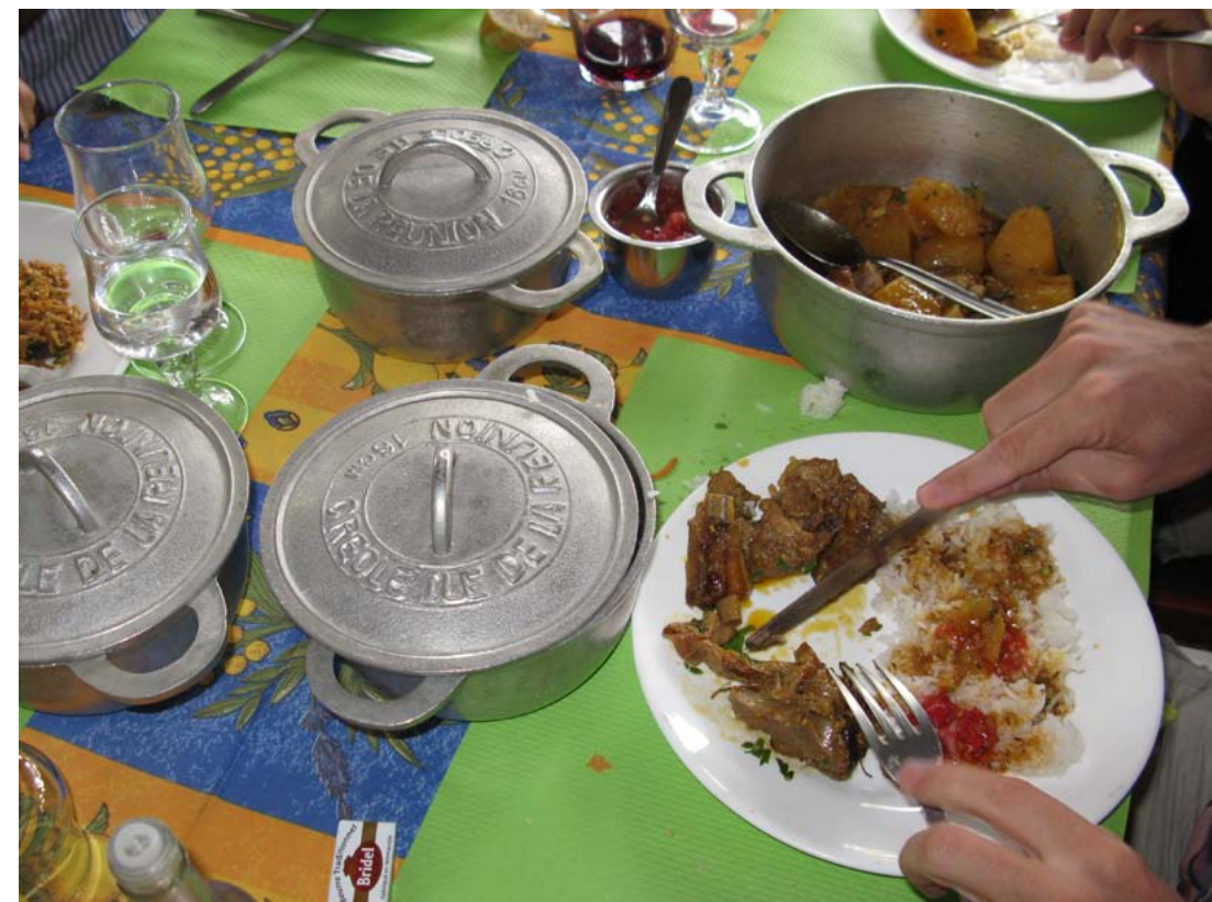
Comida criolla: rougail cabrit servido en diversas cazuelas típicas del lugar. (Foto: J. M. Fernández-Palacios).

aceptables de conservación. De hecho, recientemente los excepcionales valores geológicos, geomorfológicos, ecológicos, así como de biodiversidad florística y faunística de la isla, han sido reconocidos internacionalmente: primero, con su declaración como Parque Nacional de La Reunión (2007); y posteriormente con la nominación de su zona central como Patrimonio Mundial de la Humanidad de la UNESCO (2010). El Parque Nacional cuenta con una superficie aproximada de 105.000 ha (el 42 % de la superficie insular), de modo que, con excepción de las costas y las zonas habitadas de las medianías, incluye prácticamente todas las áreas bien conservadas de la isla, recogiendo en su seno a las masas fores-