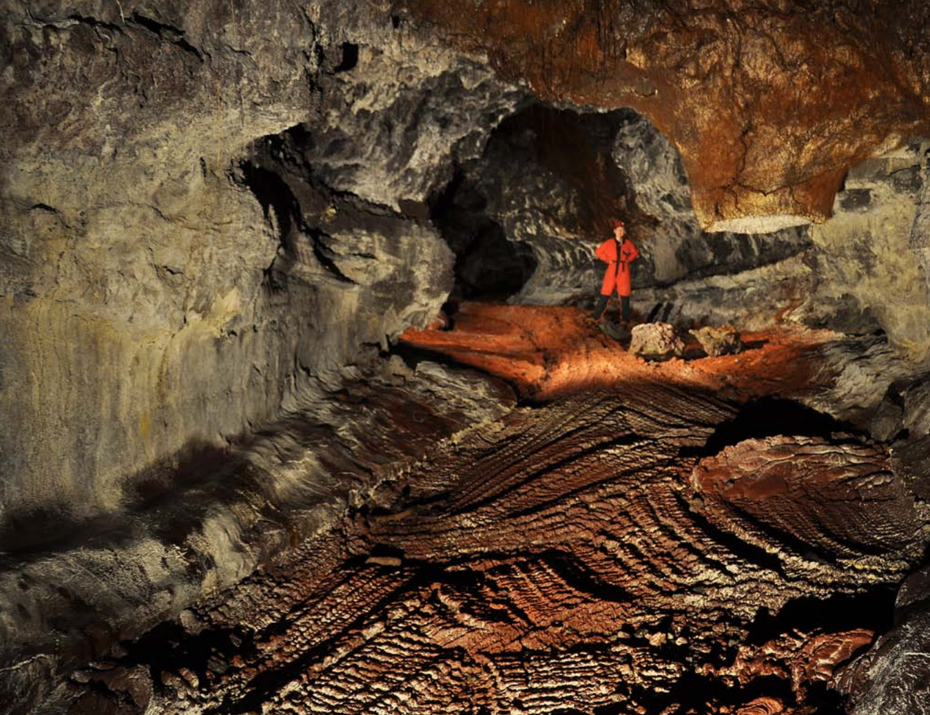
La Grotte des Gendarmes, tubo volcánico situado cerca de St. Philippe, en el sur de la isla.

Entre los 560 lepidópteros censados en La Reunión (Martiré & Rochat, 2008) hay 40 especies de mariposas diurnas, bastantes más que en la fauna presente en Canarias. Merecen especial atención Antanartia borbonica borbonica y Salamis angustina angustina (fam. Nymphalidae), altamente amenazadas, cuyas correspondientes subespecies de Mauricio, A. b. mauritiana y S. a. vinsoni , están ya actualmente extintas.