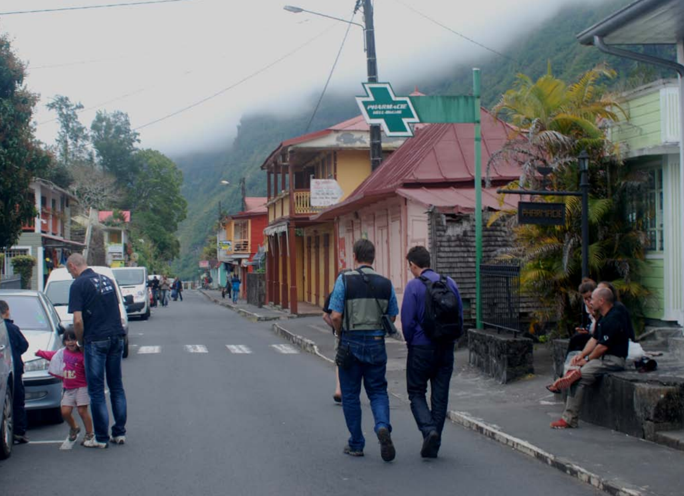
Calle principal de Hell-Bourg, la mayor población del circo de Salazie.

la araña Trogloctenus briali (fam. Ctenidae), con solo otra especie congénica en cuevas del Congo, o los coleópteros microftalmos Neocolpodes poussereaui (fam. Carabidae) y Lobrathium pauliani (fam. Staphylinidae).