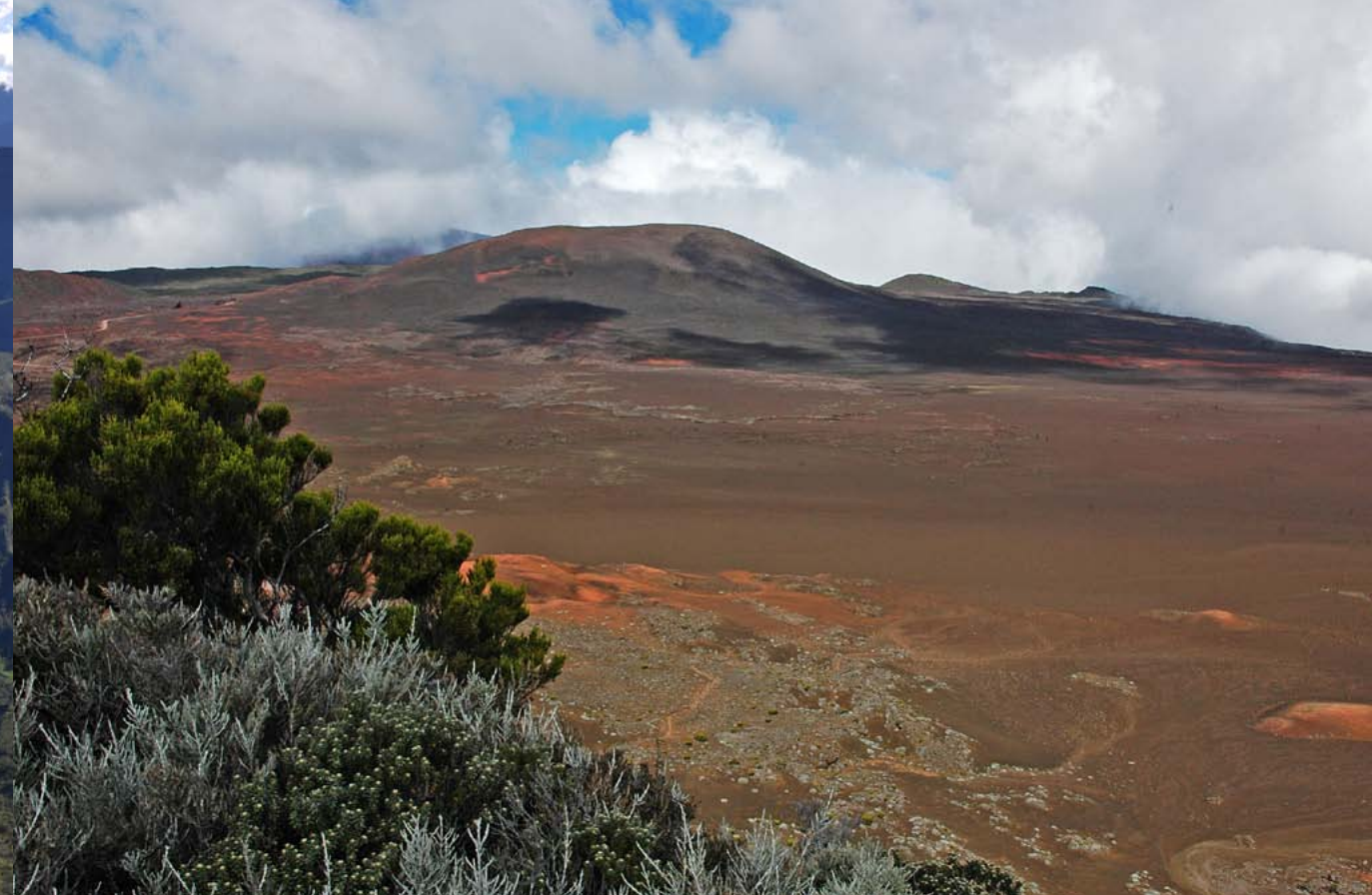
La Plaine des Sables, primera de las calderas concéntricas en dirección hacia el Piton de la Fournaise. En primer término, una muestra de las ericáceas endémicas que caracterizan la zona.