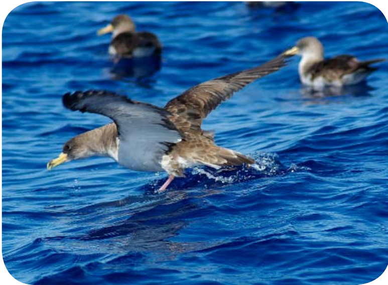
Calonectris diomedea borealis

Boletín de la Asociación Amigos del Museo de la Naturaleza y el Hombre