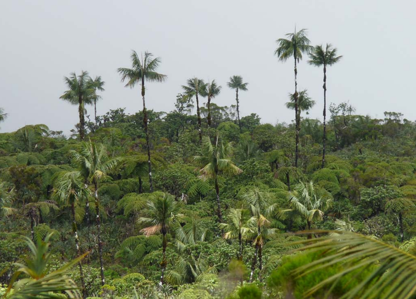
Bosque relíctico de palmeras ( Acanthophoenix rubra ) en zona montana húmeda.