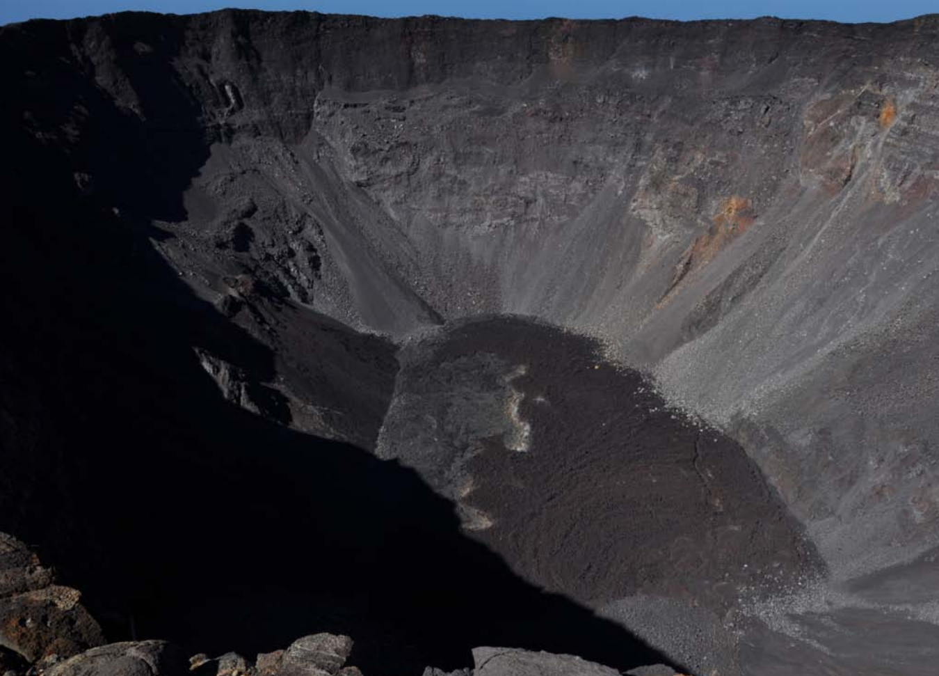
Cráter del Piton de la Fournaise, uno de los volcanes más activos del mundo.

hasta la actualidad. Por efecto de las continuas erupciones (la última en febrero de 2015) la isla va ganando terreno al mar por el sureste. La zona de contacto entre los dos macizos es un amplio y suave corredor formado por la Plaine des Cafres al oeste y la Plaine des Palmistes al este, que por su suavidad constituye el único paso posible por carretera a través de la isla, por el Col de Bellevue (1.606 m).