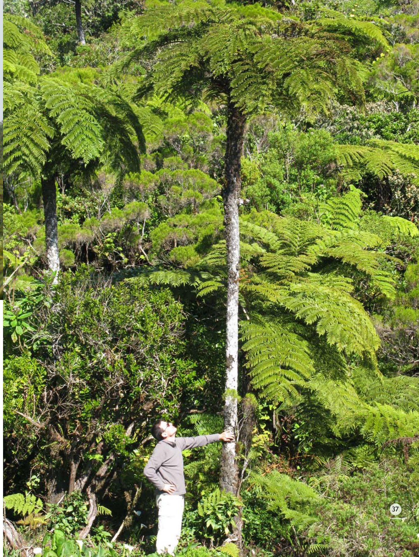
Helechos arborescentes endémicos ( Cyathea glauca ) en el Col de Bellevue..

separen 4.000 km del extremo meridional de la península indostánica frente a solamente unos 1.600 km en línea recta del continente africano (Warren et al. , 2009). Sin duda, a esta afinidad ha contribuido el aumento de tamaño de los atolones o la emersión de muchos montes submarinos de los archipiélagos de Maldivas y Chagos, ligados a las regresiones glaciales del nivel del mar, pero sobre todo de las extensísimas plataformas costeras situadas al NE de Las Mascareñas (como Nazaret, Sayá de Malhá, Saint Brandon o la plataforma granítica de las Seychelles), que al emerger durante los periodos glaciales habrían facilitado la conexión de todas ellas y de Madagascar con la India e Indonesia. Es también interesante el hecho de que la mayor parte de la población humana malgache y su lengua principal son de origen indonesio y no africano.