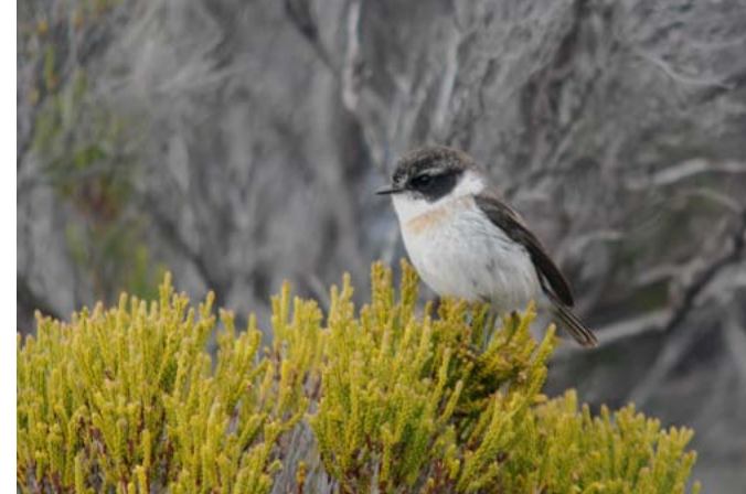
La abundante tarabilla de La Reunión ( Saxicola tectes ) es conocida localmente como “tec-tec”.

dos especies por su especial interés: el petrel de La Reunión ( Pseudobulweria aterrima ), que nidifica exclusivamente en esta isla y durante el último censo solo se encontraron 10 crías, y el petrel de Barau ( Pterodroma barauii ), que también cría en Rodrigues; estas especies están catalogadas por la UICN como “En peligro crítico” y “En peligro”, respectivamente. Otras 20 especies son acuáticas y limícolas, muchas de ellas migradoras; y entre las 31 restantes hay cinco endemismos locales: Coracina newtoni (fam. Campephagidae), Hypsipetes borbonicus (fam. Pycnonotidae), Saxicola tectes (fam. Muscicapidae), Terpsiphone bourbonensis (fam. Monarchidae) y Zosterops olivaceus (fam. Zosteropidae). El endemismo sin duda más amenazado es el oruguero de La Reunión ( Coracina newtoni , “tuit tuit” en créole ), en peligro crítico de extinción probablemente por causa de las ratas. El bulbul de La Reunión ( Hypsipetes borbonicus ), del tamaño y aspecto de un mirlo, ha sufrido bastante regresión por ser utilizado como pájaro de jaula. Uno de los passeriformes más populares es la tarabilla de La Reunión ( Saxicola tectes ) o tec-tec , como se la denomina en lengua criolla; es abundante y tiene una amplitud ecológica bastante mayor que la tarabilla canaria. El endemismo local más llamativo es el pequeño papamoscas de La Reunión ( Terpsiphone bour-