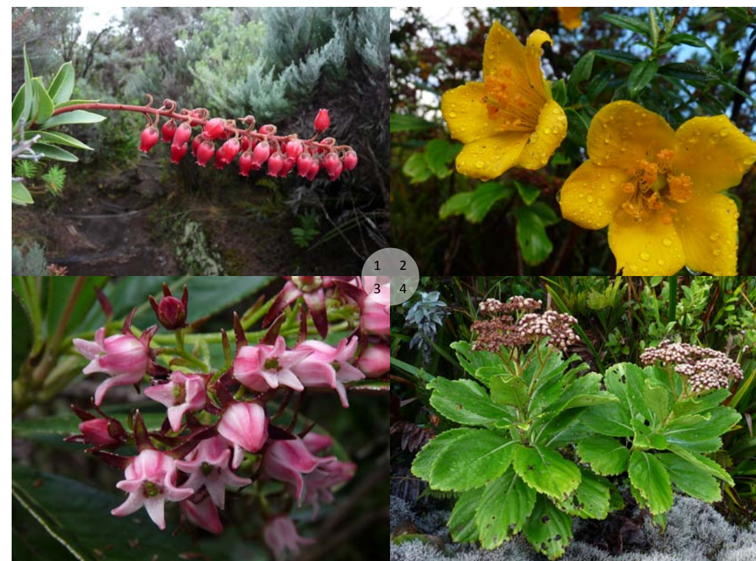
1. La planta ericáca endémica Agarista buxifolia es un pequeño arbusto propio de espacios abiertos de zonas altas. (Foto: C. Thébaud). / 2. Hypericum lanceolatum , endemismo de La Reunión, propio del matorral de cumbre. (Foto: C. Thébaud). / 3. Forgesia racemosa (fam. Escalloniaceae), género endémico con esta única especie arbustiva, localmente abundante por su carácter pionero. (Foto: C. Thébaud). / 4. Psiadia boivinii (fam. Asteraceae), arbusto de hasta 3 m de altura propio de bosques húmedos entre 700 y 1.700 m. (Foto: C. Thébaud).

Como Canarias, La Reunión es uno de los 25 puntos calientes ( hotspots ) de la diversidad biológica mundial (Myers et al. , 2000) y uno de los 234 Centros de Diversidad de Plantas según la WWF y la IUCN (1994). Según estimaciones del Index de la flore vasculaire de La Réunion (MASCARINE-Index) recogidas en Boulet (2006), la flora vascular de La Reunión se compone actualmente de 1.708 especies de plantas vasculares (1.457 espermatófitos y 251 pteridófitos), de las cuales 835 son nativas (solo “nativas probables” en 81 de los casos), 826 exóticas y 47 indígenas posibles. La flora briofítica está compuesta por 826 especies, de las cuales 499 son musgos, 322 he-