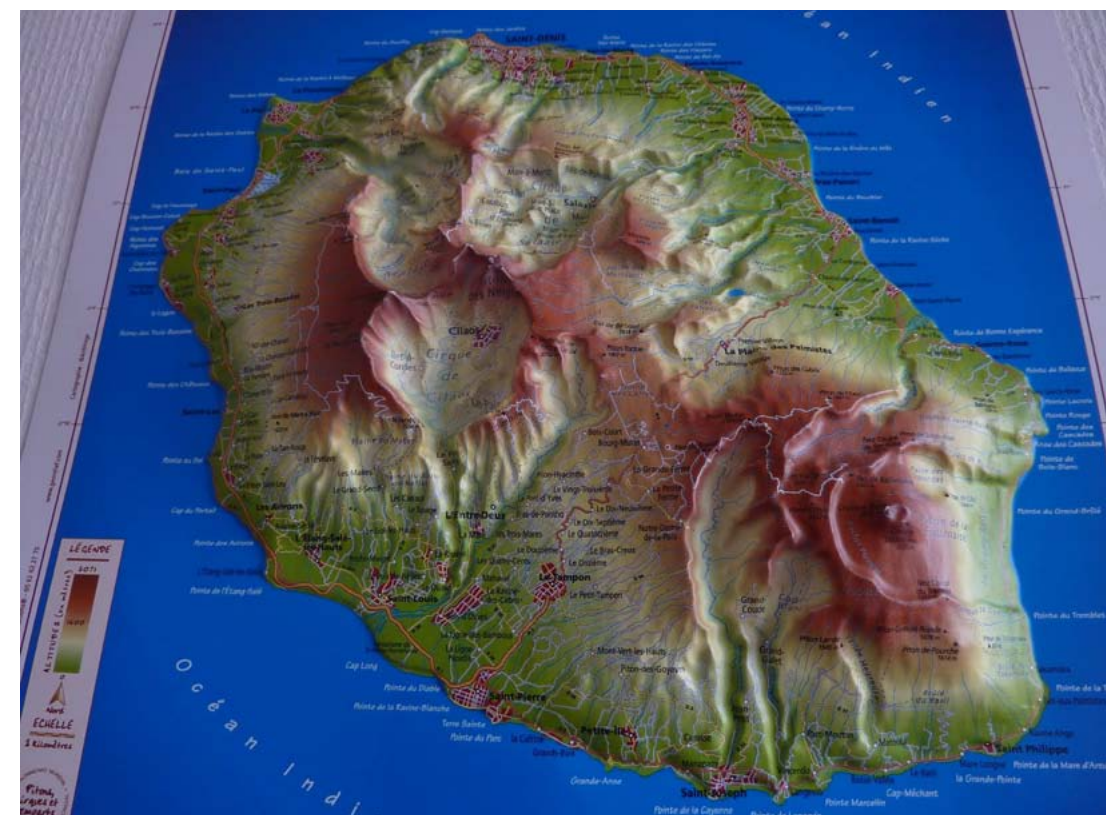
Mapa tridimensional de La Reunión. (Foto: E. Boutleux).

tarse del Hemisferio Sur), que inciden de forma continua sobre la fachada sudoriental de la isla (media de 280 días de lluvia al año). Si se incluye la precipitación horizontal u oculta, en esta parte de la isla se alcanzan los valores más altos de lluvia, que pueden llegar a los 12.000 mm al año entre los 1.500 y 1.800 m de altitud, cifras que se codean con las más altas del planeta. Sin embargo, debido a la importante altitud de la isla, al igual que pasa en Canarias o en Hawái, estas nubes cargadas de agua apenas alcanzan las fachadas a sotavento (en este caso las occidentales), de manera que también la isla tiene zonas de escasas precipitaciones (500 mm en la costa noroccidental) en las que crecen comunidades propias de zonas más áridas. Además,