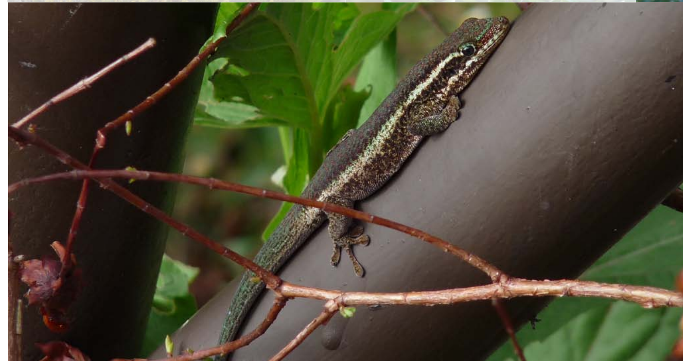
Este perenquén diurno pertenece a una probable especie no descrita del género Phelsuma . (Foto: C. Thébaud).