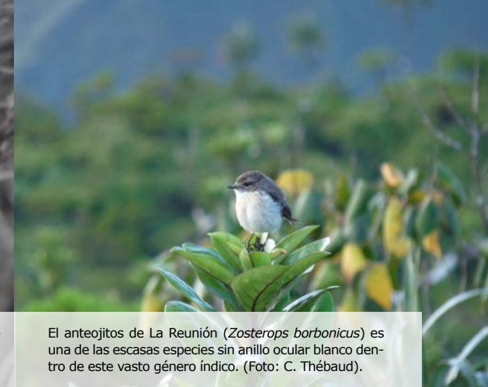
El anteojitos de La Reunión ( Zosterops borbonicus ) es una de las escasas especies sin anillo ocular blanco dentro de este vasto género índico. (Foto: C. Thébaud).