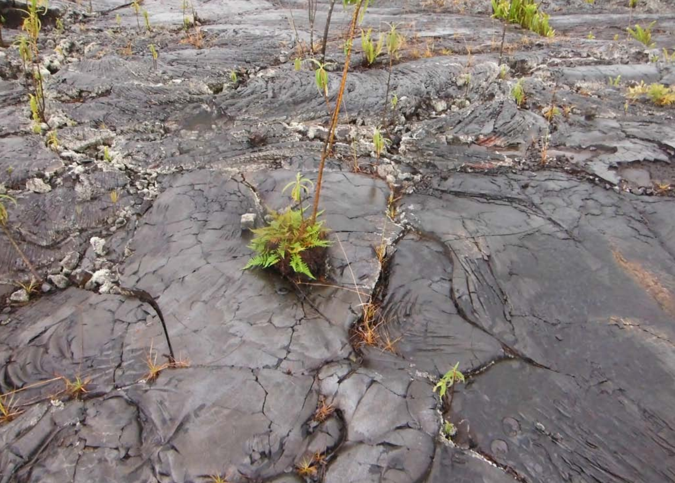
Rápido poblamiento vegetal de coladas pahoehoe de la erupción de 2010 del Piton de la Fournaise, a 100 m s.n.m..