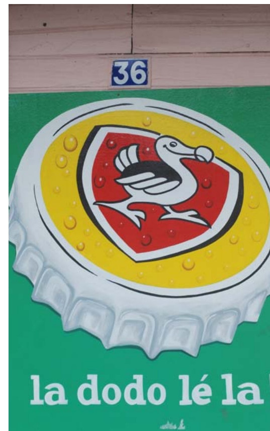
Anuncio de la famosa cerveza local Bourbon. En créole "El Dodó está aquí", apoderándose del símbolo del dodó, originario de Mauricio.

Las islas Mascareñas deben su nombre al navegante portugués que las descubrió (Pedro de Mascarenhas) allá por 1513, denominando a La Reunión como Santa Apolonia. Aunque deshabitadas