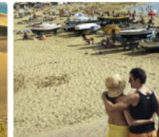
Discover Gran Canaria!

Breakfast at the Maspalomas Dunes? Sailing amongst dolphins? Would you like to discover Gran Canaria?